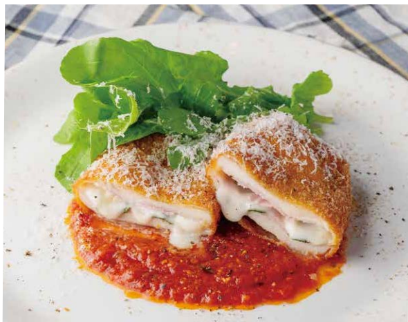
紀州うめどりとスモークチーズの ポルタフォーリオ