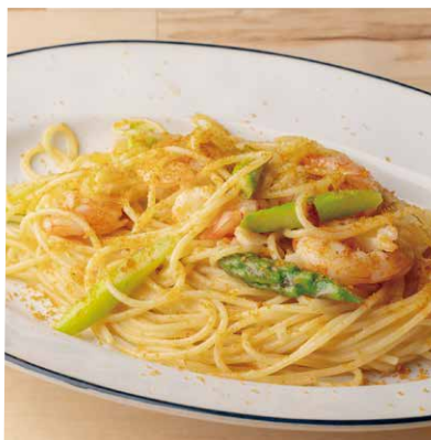
天然海老とカラスミの ペペロンチーノ 1730 Peperoncino with Wild Shrimp and Dried Mullet Roe