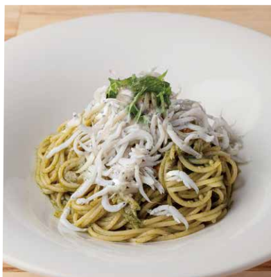
和歌山県湯浅産しらすと 大葉のジェノベーゼ 1550 Genovese Made with Whitebait and Shiso Leaves From Yuasa, Wakayama Prefecture