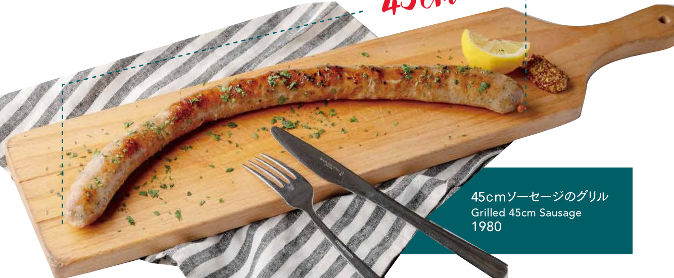
45cmソーセージのグリル Grilled 45cm Sausage 1980