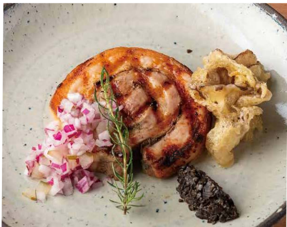
優味豚のポルケッタ Yumi Pork Porchetta