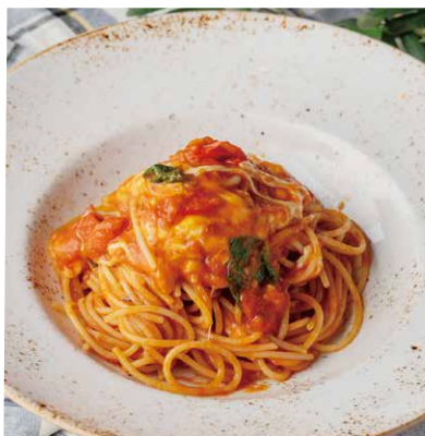
モッツアレラチーズと バジルのトマトソース 1480 Tomato Sauce with Mozzarella Cheese and Basil