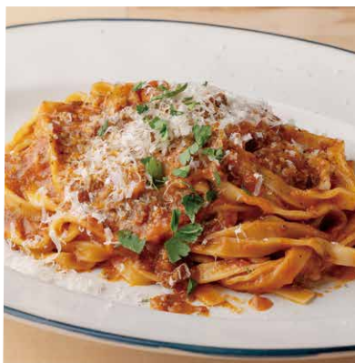
淡路牛のボロネーゼ 1780 <生パスタ タリアテッレ> Awaji Beef Bolognese <Fresh Pasta Tagliatelle>