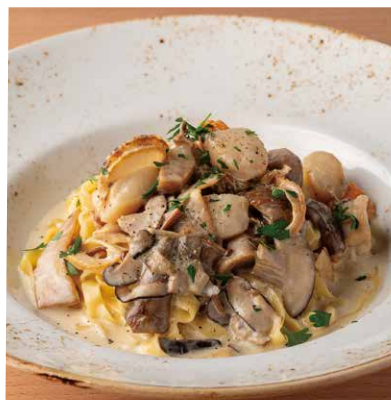
帆立のポルチーニクリーム 1780 <生パスタ タリアテッレ> Scallops With Porcini Cream <Fresh Pasta Tagliatelle>