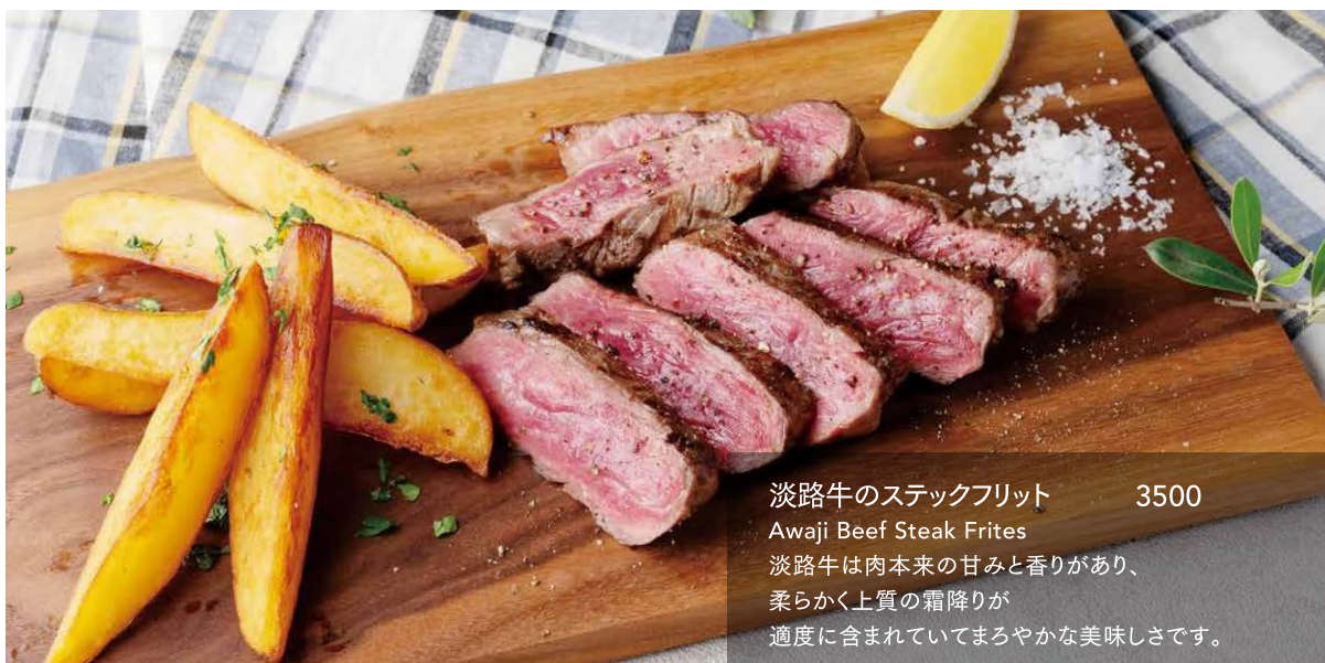
淡路牛のステーキフリット 3500

Kishu Ume Chicken and Smoked Cheese Portafoglio