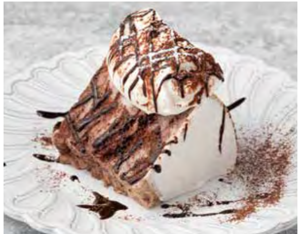
エンゼルフードケーキ ショコラ 700

しっとりフワフワ生地にクリームとキャラメルソース。 ボリューム満点の人気スイーツ。