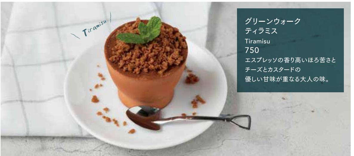
グリーンウォーク ティラミス