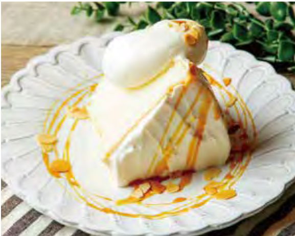
エンゼルフードケーキ バニラキャラメル 700